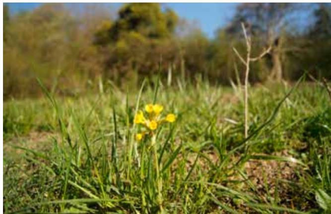
Die Wiesen-Schlüsselblume, hier auf dem „Metschenberg“ nach den Entbuschungsarbeiten im Frühjahr 2016, blüht als eine der ersten Pflanzen der Trockenrasen bereits Mitte April.

Kalkmagerrasen sind typische Lebensräume von südexponierten, im Sommer sehr trockenen Standorten. Auf den nährstoffarmen Böden entsteht eine Lebensgemeinschaft mit niedriger Vegetation und speziell angepassten Pflanzenarten. Hinzu kommen typische Tierarten, die auf den niedrigen Bewuchs und eine starke Besonnung angewiesen sind. Viele dieser Arten sind inzwischen selten geworden, was auf den Rückgang dieses früher sehr verbreiteten Lebensraums zurückzuführen ist. Typische Arten sind etwa die frühblühenden Wiesen-Schlüsselblume oder der stark gefährdete Wiesen-Salbei. Aber auch gefährdete Vogelarten, wie etwa den Wendehals, findet man hier.