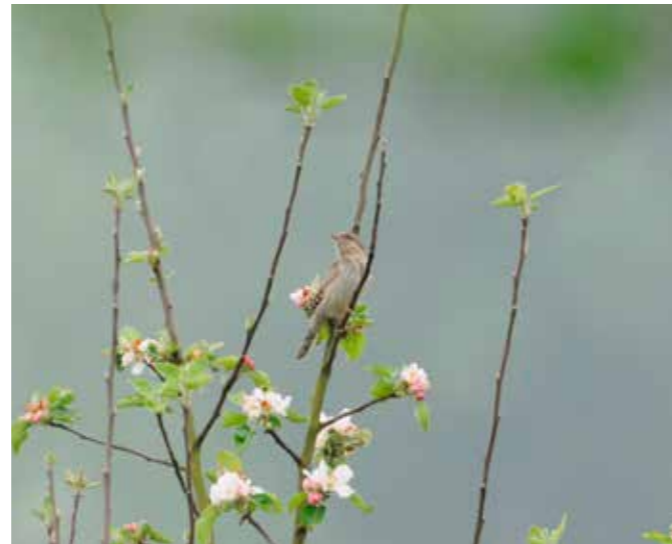
Der Wendehals ist eine seltene Specht-Art, die bei uns typischerweise auf extensiv beweideten Trockenrasen lebt und sich dort von Ameisen ernährt.

Der rezente Strukturwandel in der Landwirtschaft führte dazu, dass Grenzertragsflächen immer häufiger ganz aus der Nutzung genommen werden und brachfallen oder zumindest unternutzt werden. Diese Entwicklung gefährdet die restlichen Kalkmagerrasen, da sie zur Verbuschung der Flächen, oft mit Schlehen, führen.