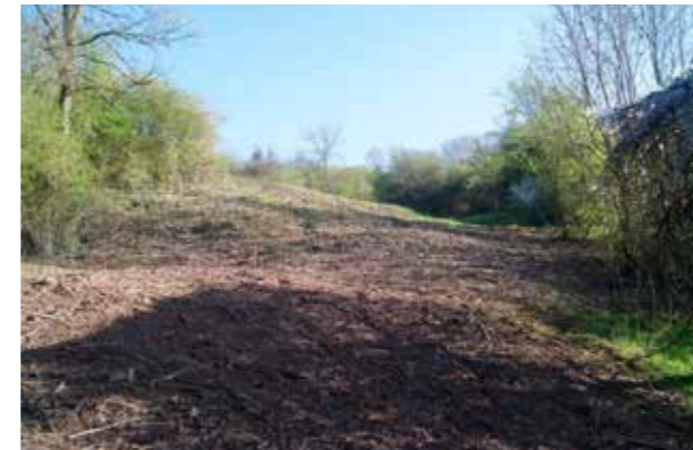
Der Kalkmagerrasen des „Metschenberg“ nach der Entbuschung und ein halbes Jahr später. Das Bild zeigt deutlich, dass sich die Vegetation gut erholt hat und die typischen Arten der Magerrasen wieder auf der Fläche vorkommen.

Dieses Schicksal teilen auch viele Flächen in der Gemeinde Bettendorf. Auf Grund der besonderen Topographie des Sauerlands waren Trockenrasen hier weit verbreitet. Allerdings sind heutzutage viele Flächen weitgehend von Gehölzen überwuchert. Eine erste Schutzmaßnahme für die gefährdeten Trockenrasen wurde im Winter 2015/16 in Zusammenarbeit mit dem Naturschutzsyndikat SICONA in der Flur „Metschenberg“ durchgeführt.