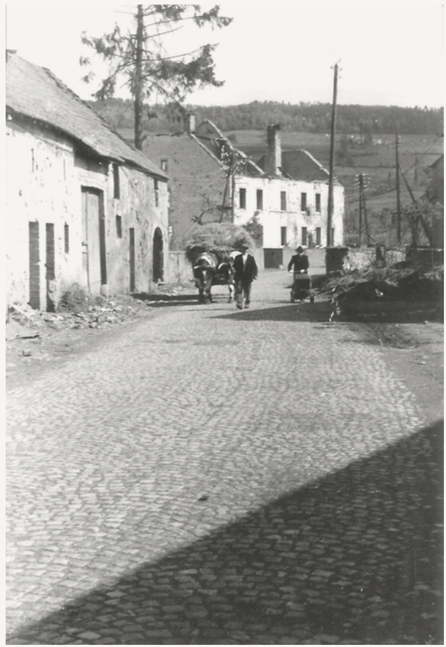
Zerstörungen in der Rue du Château