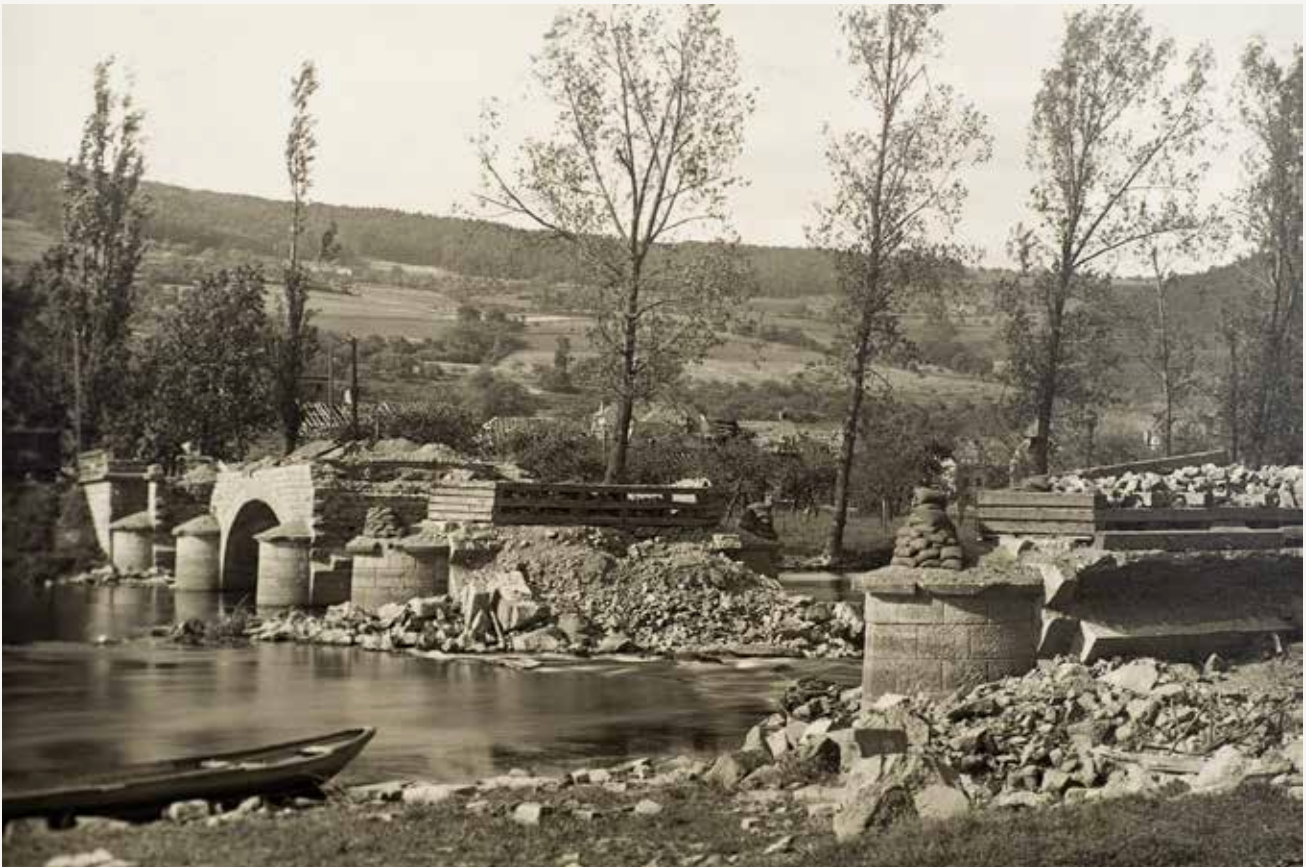
Die zerstörte Brücke in Bettendorf