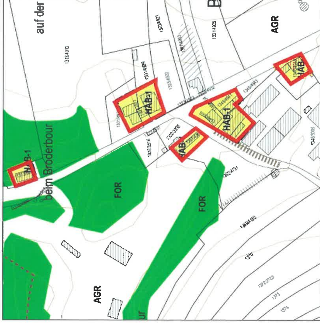
Annexe 1 : Zones d'habitation 1 [HAB-1] à Broderbour

La présente fait partie intégrante de ma décision du